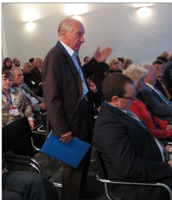
Симпозіум “Сучасні проблеми нанокаталізу” Ужгород, 24–28 вересня 2012 р.

В 1970–1980 рр. на замовлення КБ “Південне” (м. Дніпропетровськ) було розроблено методику прискореного тестування полімерних матеріалів та проведено розшифровку газових фонів ракетних пускових шахт.